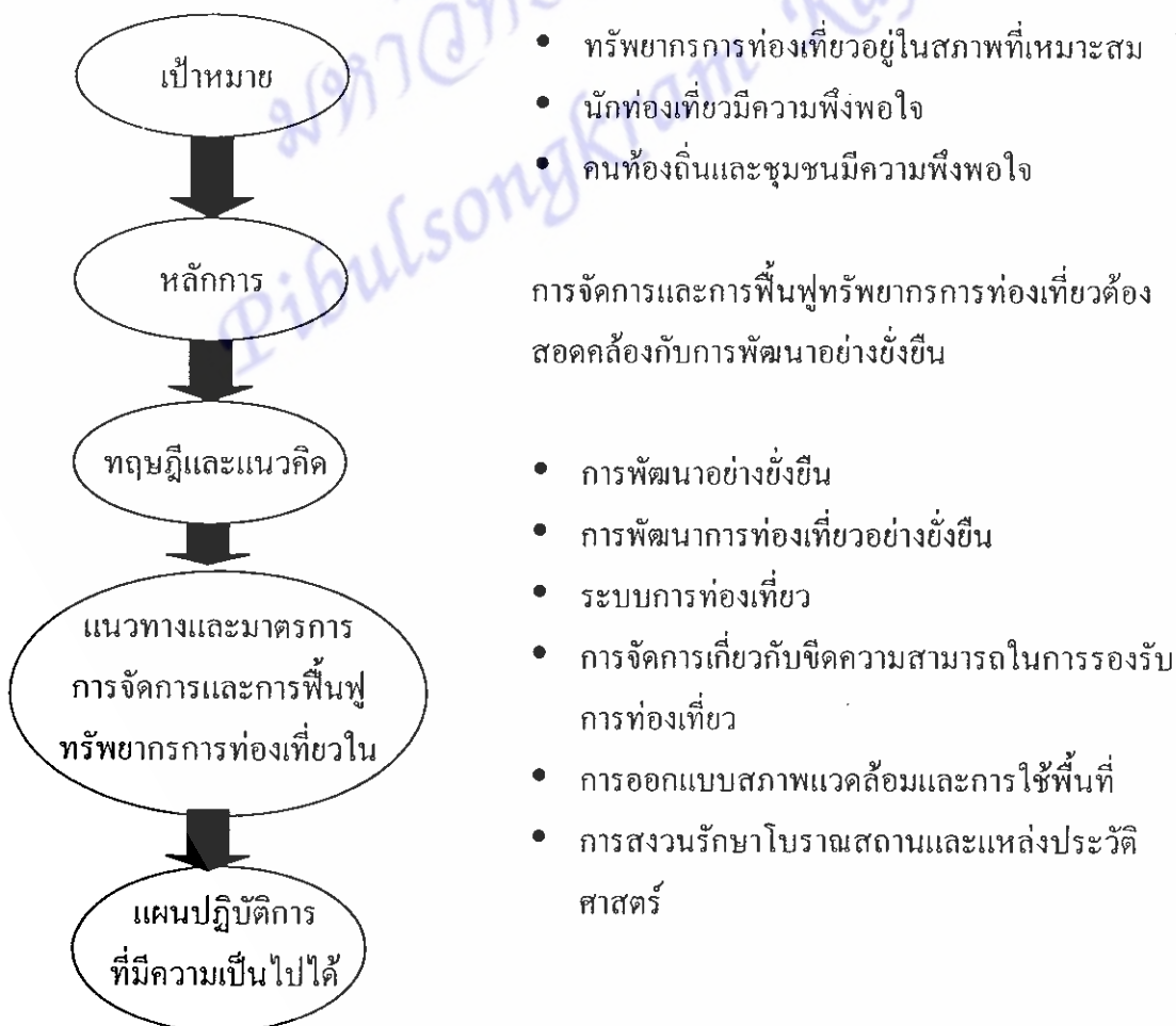
รูปที่ 1 : กรอบความคิดของการจัดการและฟื้นฟูทรัพยากรการท่องเที่ยว

การจัดการและการฟื้นฟูทรัพยากรการท่องเที่ยว เป็นกระบวนการที่มีความสำคัญอย่างยิ่งในการปรับปรุงและส่งเสริมให้ทรัพยากรการท่องเที่ยวอยู่ในสภาพที่เหมาะสมและเป็นที่ประทับใจของนักท่องเที่ยว และช่วยให้การท่องเที่ยวมีการพัฒนาอย่างยั่งยืนตามแผนพัฒนาการท่องเที่ยวในแผนพัฒนาเศรษฐกิจและสังคมแห่งชาติฉบับที่ 9 อย่างไรก็ตาม การจัดการและการฟื้นฟูทรัพยากรการท่องเที่ยวอย่างมีประสิทธิภาพจะต้องดำเนินไปอย่างมีทิศทาง โดยอาศัยกรอบความคิด (Framework) ที่เหมาะสมเป็นเข็มทิศชี้นำทิศทาง กรอบความคิดดังกล่าวได้แก่เป้าหมาย (Goal) หลักการ (Principle) และทฤษฎีและแนวคิด (Theories and concepts) ซึ่งแสดงไว้ในรูปที่ 2.1