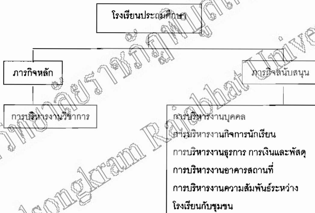
แผนภูมิ 1 โครงสร้างการบริหารโรงเรียนประถมศึกษา

สุรัตน์ ดวงชาตม (2539 : 1) กล่าวว่า การบริหารโรงเรียนประถมศึกษา หมายถึง กิจกรรมของผู้บริหารและบุคลากรในโรงเรียนได้ดำเนินงานร่วมกันเพื่อให้การบริการทางการศึกษา โดยเน้นการพัฒนาความรู้แก่เยาวชนตามบทบาท อำนาจหน้าที่ ภารกิจ และขอบข่ายงานที่กำหนดไว้ โดยสำนักงานคณะกรรมการการประถมศึกษาแห่งชาติได้กำหนดโครงสร้างการบริหารโรงเรียนประถมศึกษาไว้รวม 6 ด้าน คือ การบริหารงานวิชาการ การบริหารงานบุคลากร การบริหารงานกิจการนักเรียน การบริหารงานธุรการการเงินและพัสดุ การบริหารงานอาคารสถานที่และการบริหารงานความสัมพันธ์ระหว่างโรงเรียนกับชุมชน ดังแสดงไว้ในแผนภูมิ 1 ดังนี้