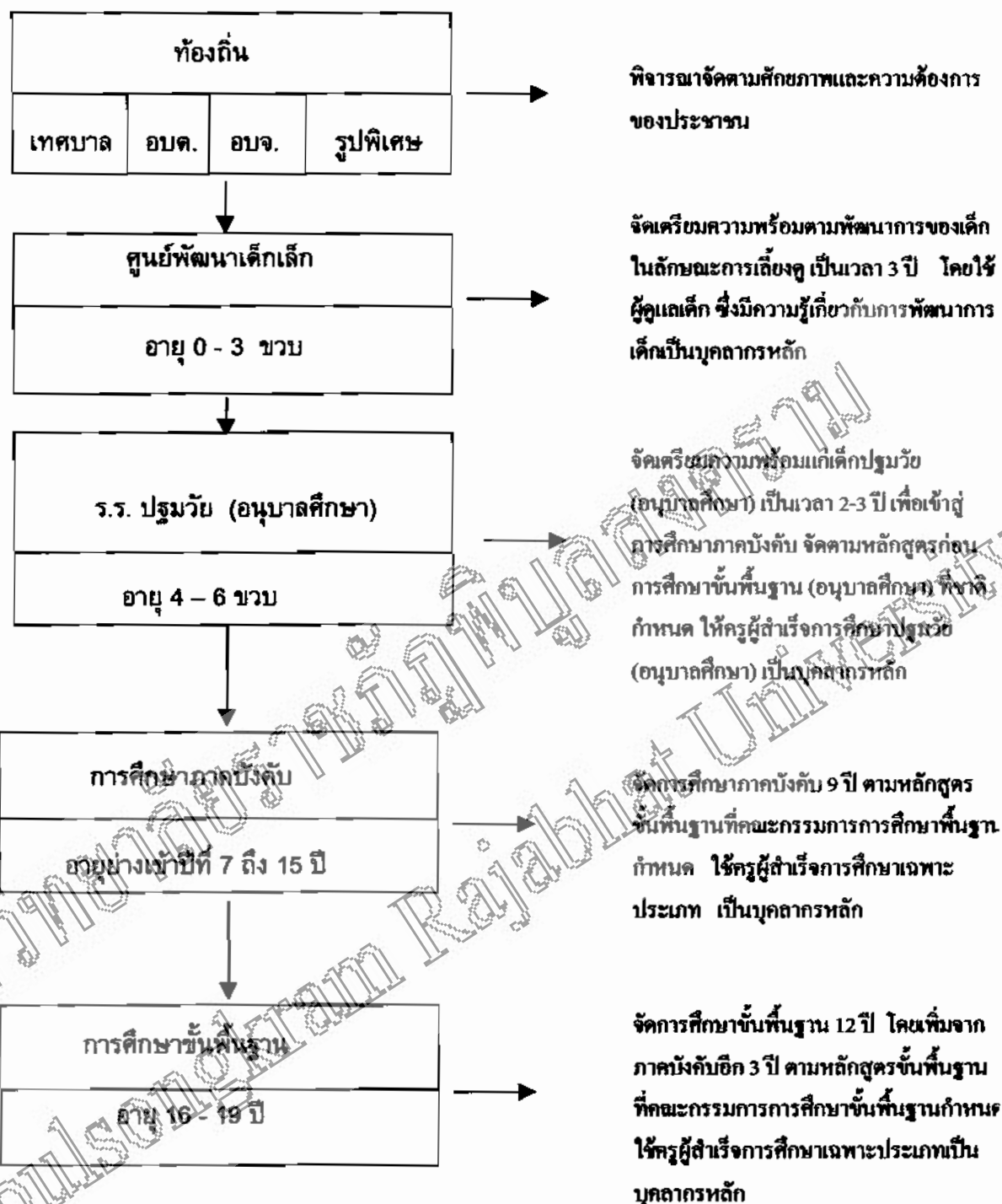
แผนภูมิ 3 โครงสร้างกระจายอำนาจการจัดการศึกษาแก่องค์กรปกครองส่วนท้องถิ่น ในการจัดการศึกษาปฐมวัยและการศึกษาขั้นพื้นฐาน ( ตามมติ ครม. เมื่อวันที่ 16 มีนาคม 2542 และ พ.ร.บ.การศึกษาแห่งชาติ พ.ศ.2542 ) ( กรมการปกครอง. 2543 )