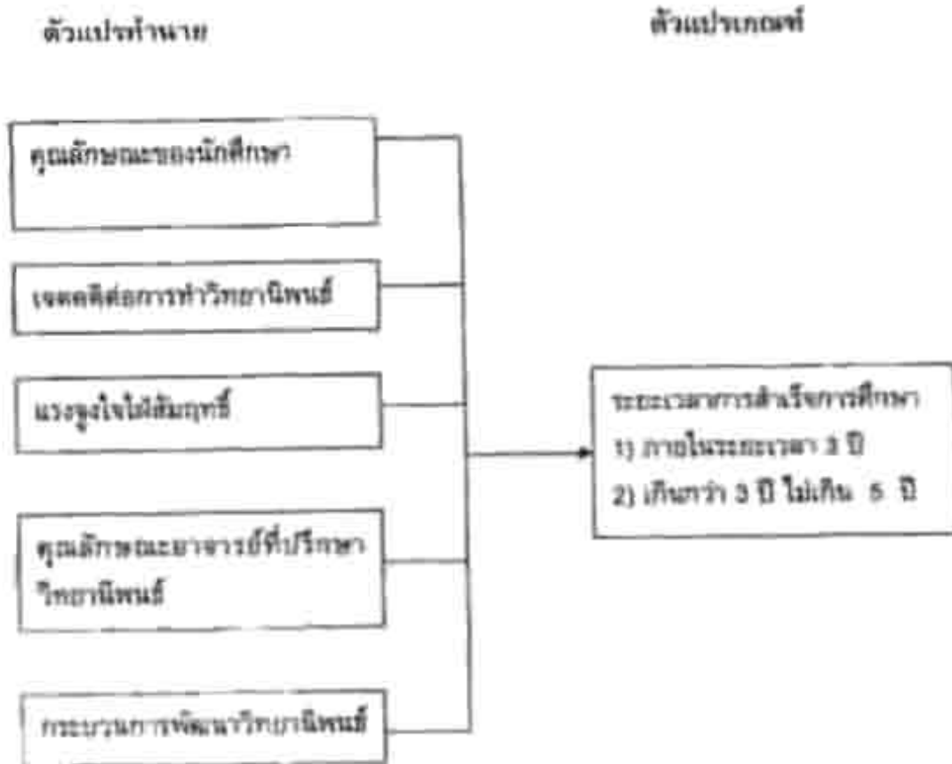
ภาพประกอบ 2 กรอบแนวคิดในการวิจัย