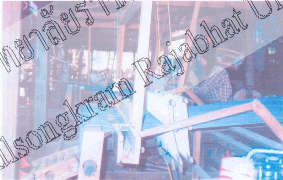
แหล่งทอผ้า ของกลุ่มอาชีพทอผ้า บ้านม่วงหอม