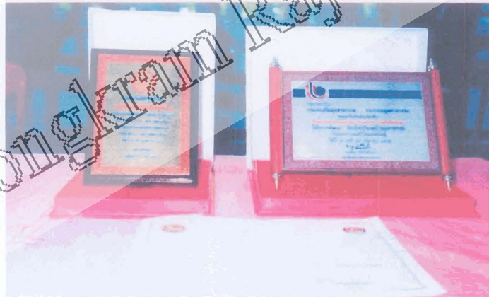
รางวัลคุณภาพ จากผ้าทอที่กลุ่มอาชีพทอผ้าบ้านม่วงหอม ได้รับ

มหาวิทยาลัยราชภัฏเทพสตรี Pibulsongkram Rajabhat University