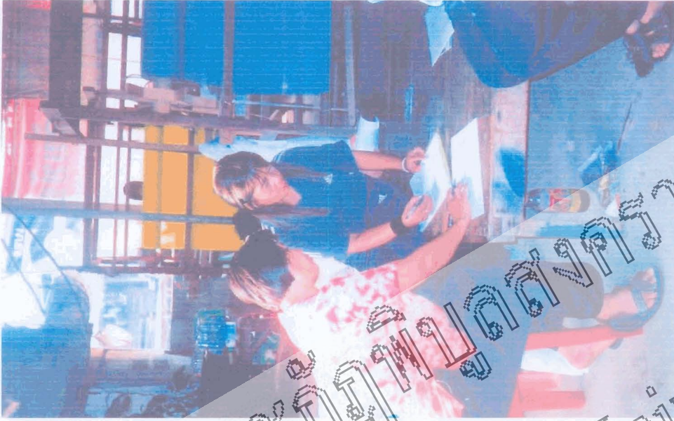
การเก็บรวบรวมข้อมูล