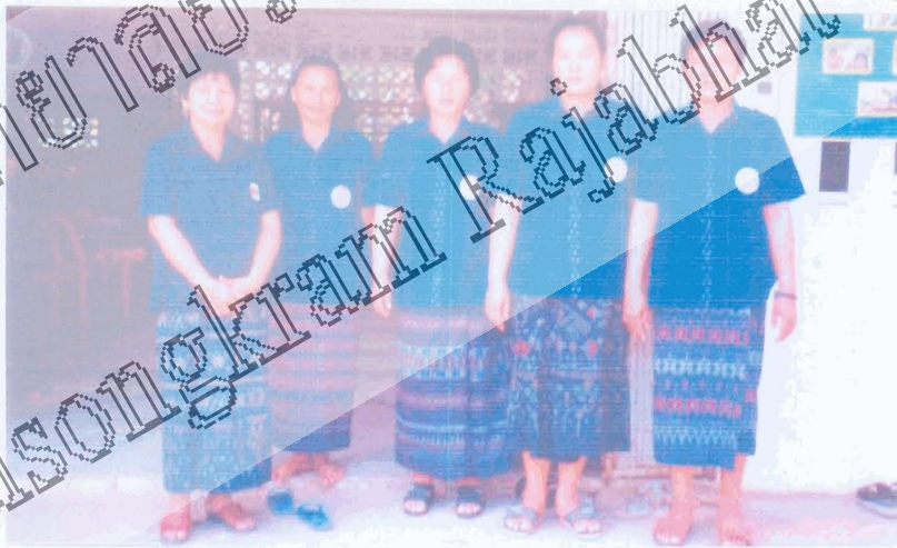
คณะกรรมการกลุ่มอาชีพทอผ้า บ้านม่วงหอม หมู่ที่ 5 ตำบลแก่งโสภา อำเภอวังทอง จังหวัดพิษณุโลก