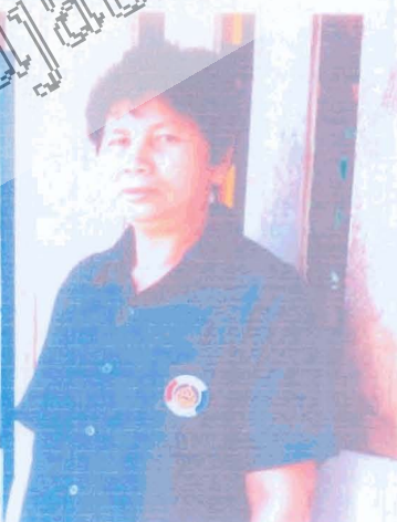
ประธานกรรมการกลุ่มอาชีพทอผ้า

มหาวิทยาลัยราชภัฏพิบูลสงคราม Pibulsongkram Rajabhat University