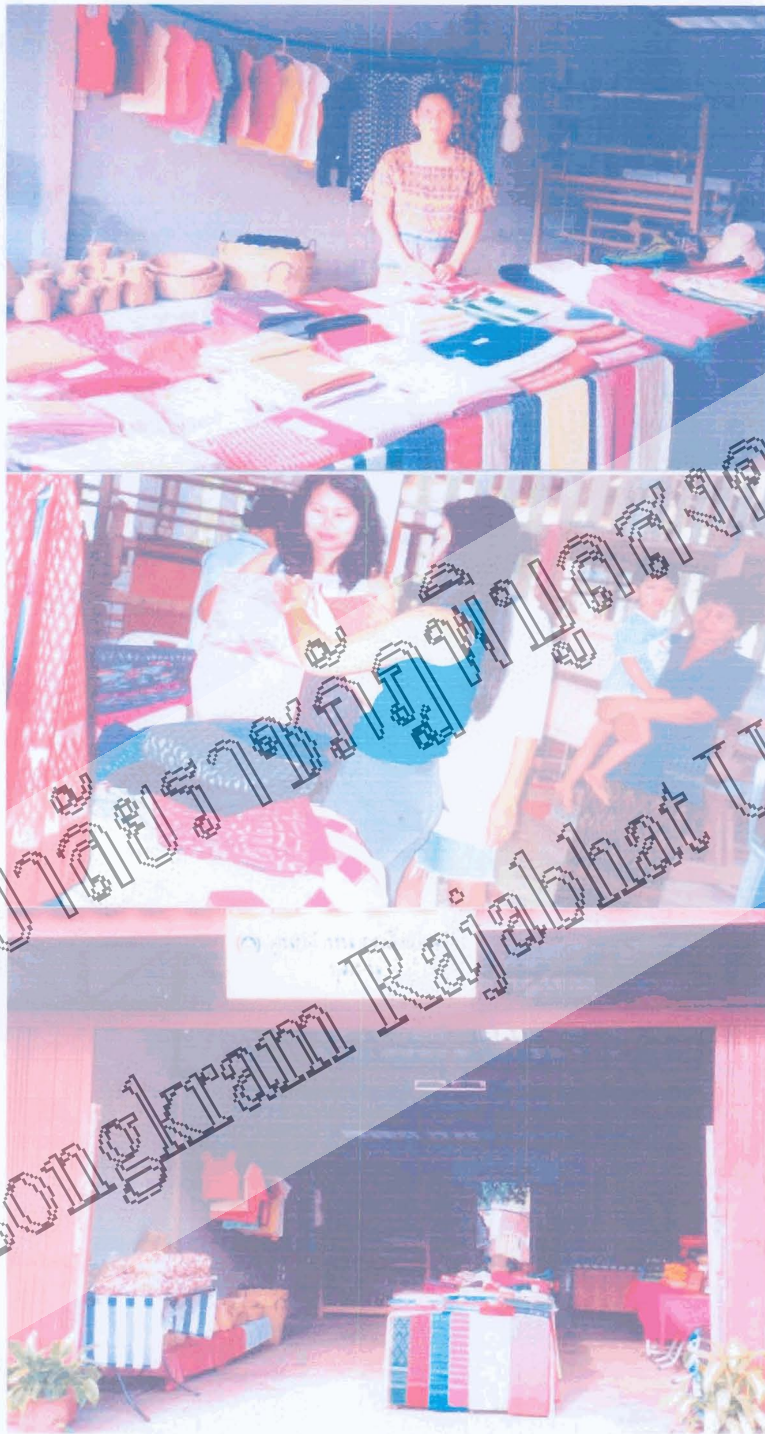
สถานที่จัดแสดงสินค้าและผลิตภัณฑ์จากผ้าทอ - การจำหน่ายผลิตภัณฑ์ ของกลุ่มอาชีพทอผ้าบ้านม่วงหอม