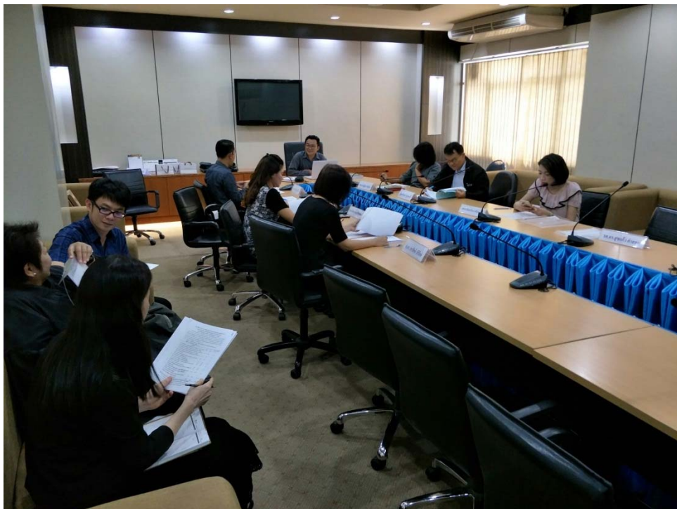
ภาพ 5 ภาพการสัมมนาผู้เชี่ยวชาญ พิจารณา “ร่าง” แนวทางการพัฒนากระบวนการพัฒนาหลักสูตร ของมหาวิทยาลัยราชภัฏพิบูลสงคราม