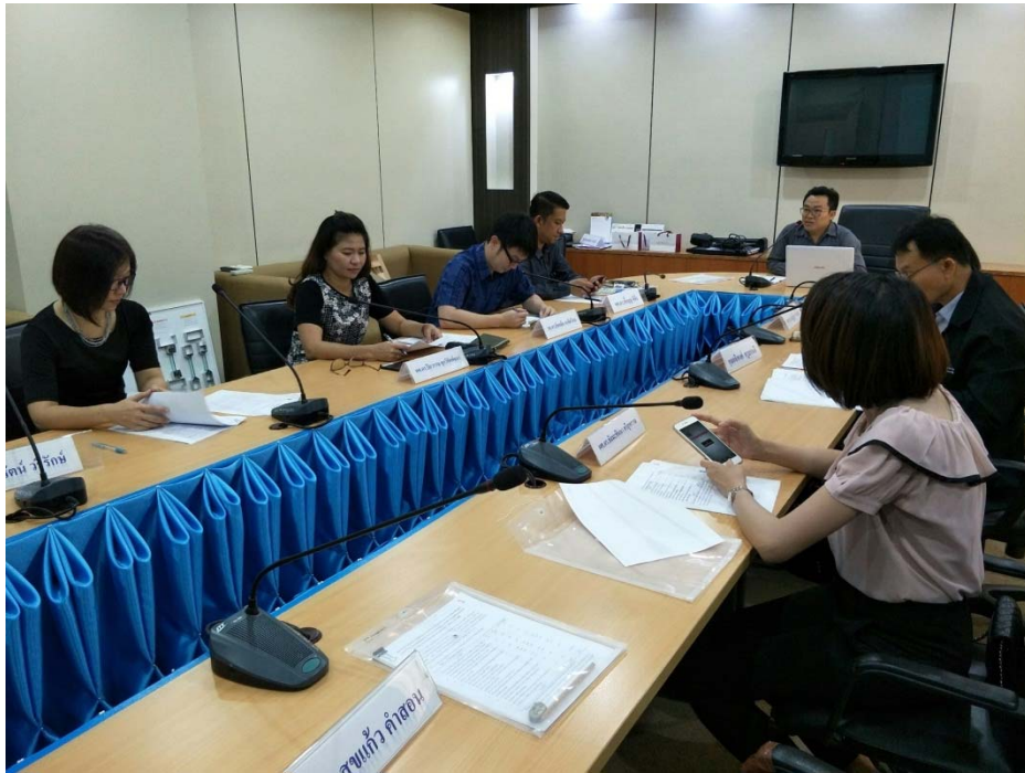
ภาพ 4 ภาพการสัมมนาผู้เชี่ยวชาญ พิจารณา “ร่าง” แนวทางการพัฒนากระบวนการพัฒนาหลักสูตร ของมหาวิทยาลัยราชภัฏพิบูลสงคราม วันศุกร์ที่ 12 พฤษภาคม พ.ศ. 2560 เวลา 13.00 น.