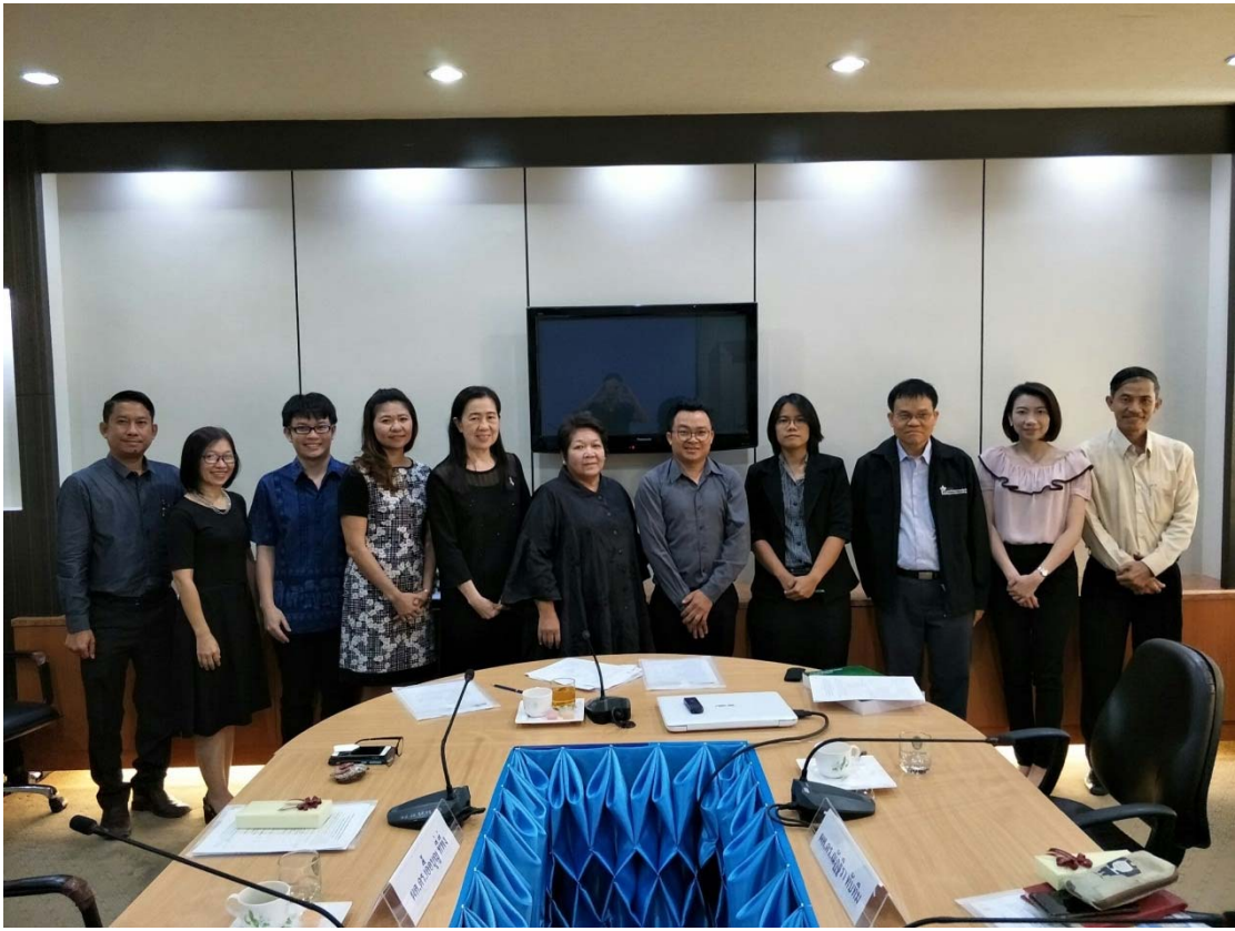
ภาพ 6 ผู้เข้าร่วมการสัมมนาและผู้สังเกตการณ์ จากซ้าย